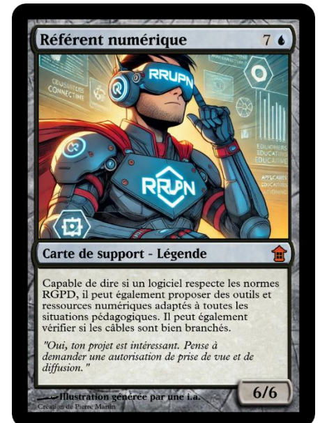
Réalisation avec l'aide d'une IA par Pierre Martin, RRUPN au collège du Dorat (87)

Le RRUPN peut également être amené, selon le contexte local, à prendre en charge une quatrième fonction, celle d'assurer le lien avec les équipes chargées de l'équipement et de la maintenance informatique. Toutefois, les missions du RRUPN doivent rester avant tout pédagogiques.